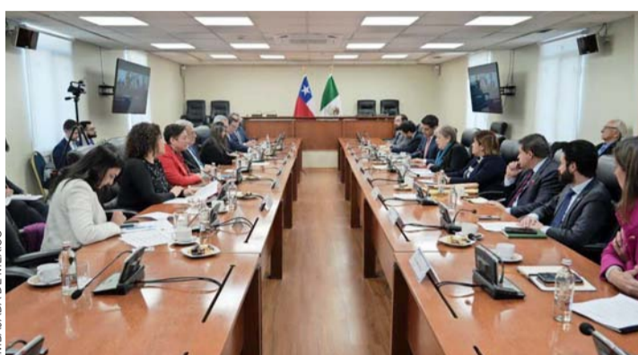
En la visita de trabajo se abordaron diferentes temas de la relación bilateral.

que México suscribe un AAE. Para la diplomacia mexicana, una Asociación Estratégica significa establecer el nivel institucional más alto de diálogo político con otro gobierno. En una Asociación Estratégica, ambos socios se reconocen como aliados en virtud de valores compartidos, de su importancia geopolítica, historia común o la intensidad (o potencial) de sus intercambios comerciales y flujos de personas. Es así como en 2006, México y Chile decidieron adoptar este modelo de relacionamiento que tiene como objetivo fortalecer la relación bilateral en los ámbitos político, económico, comercial y de cooperación, basado en la reciprocidad, el interés común, la complementariedad y la profundización de sus relaciones en todos los ámbitos de su