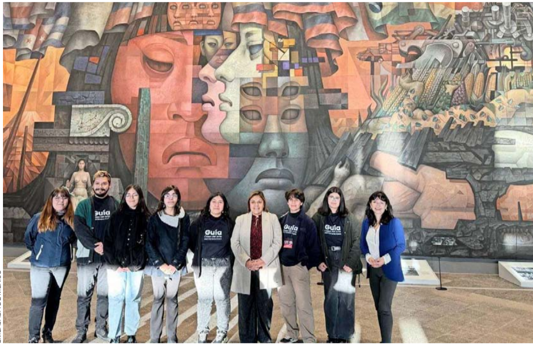
La embajada de México también se despliega en regiones. Acá una visita que realizó la embajadora a Concepción, posando frente al mural del mexicano González Camarena.

Este año la Embajada de México realizó por primera vez en la historia un Consulado Móvil