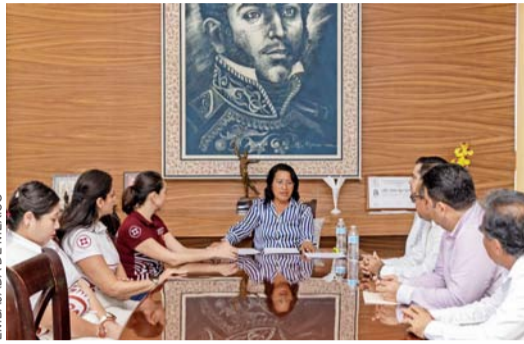
El Fondo Conjunto de Cooperación México-Chile se ha convertido en una importante herramienta.

Este Fondo dispone de un presupuesto anual y su coordinación e implementación está a cargo de la Comisión de Cooperación encabezada por los titulares de la Agencia Mexicana de Cooperación Internacional para el Desarrollo (AMEXCID) y la Agencia de Cooperación Internacional para el Desarrollo de Chile (AGCID) la cual se reúne anualmente para analizar y aprobar proyectos específicos en