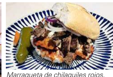
Marraqueta de chilaquiles rojos.