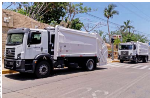
Los camiones financiados con recursos chilenos ayudaron a limpiar los efectos del huracán.

áreas prioritarias como i) Género, ii) Derechos Humanos, iii) Migraciones, iv) Cambio Climático, v) Gobierno Digital, vi) Ciencia, Tecnología e Innovación.