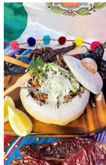
Sopa azteca en tazón de masa madre.

De esta manera, México desea dar a conocer la versatilidad de su gastronomía e impulsar a que sus connacionales alrededor del mundo mantengan sus tradiciones culinarias, adaptándolas a sus respectivas realidades, aportando ingredientes locales que complementan los platillos que les identifican como mexicanas y mexicanos.