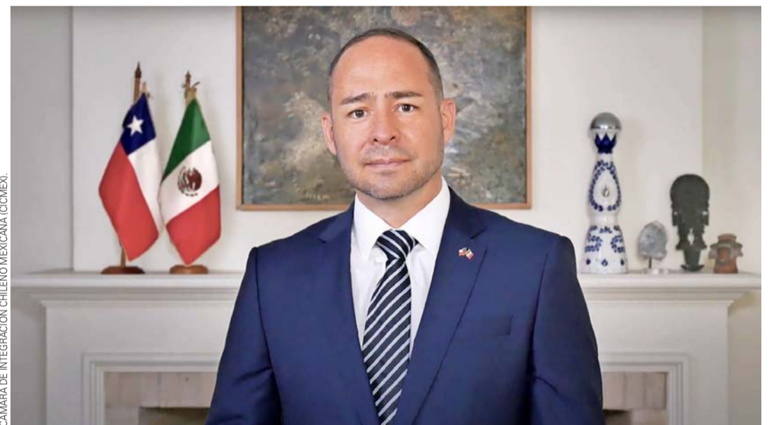
CÁMARA DE INTEGRACIÓN CHILENO MEXICANA (CICMEX)

La responsabilidad de los empresarios es muy clara: seguir aprendiendo e innovando para que la economía crezca; buscando generar un triple impacto positivo: económico, social y ambiental. En resumen, necesitamos que la actividad empresarial sea un motor para la creación de riqueza y bienestar social equitativo.