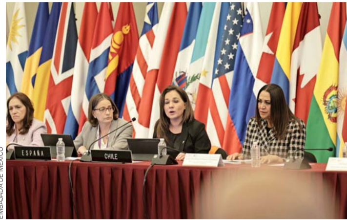
III Conferencia Ministerial sobre Políticas Exteriores Feministas que se realizó del 1 al 3 de julio.

Además, como muestra del compromiso de ambos países con el avance de la perspectiva feminista, el Fondo Conjunto de Cooperación México-Chile, decidió