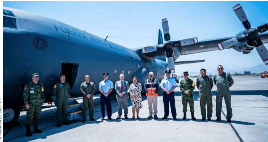
La ayuda mexicana fue muy útil para paliar los efectos de los incendios de febrero.

Con esta iniciativa se espera reducir 50% el tiempo de respuesta a personas en movilidad humana en al menos un tipo de atención/protección en los tres países referidos, así como fortalecer un modelo de certificación/vinculación laboral