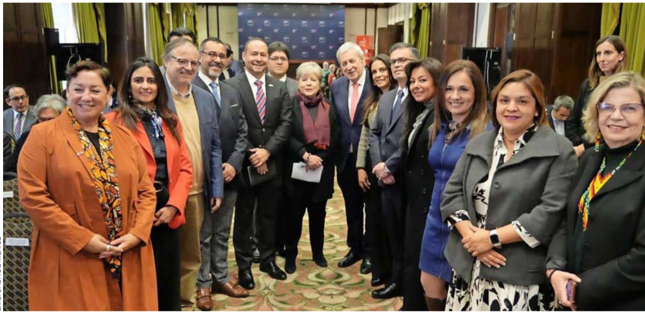
EMBAJADA DE MÉXICO

“Chile y México son países hermanos que comparten la visión de un futuro soberano”, Alicia Bárcena, Canciller de México.