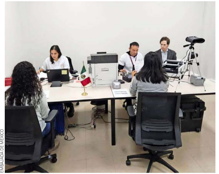
La atención a los mexicanos residentes en la zona fue muy efectiva.

En esta primera ocasión, se ofreció la renovación o tramitación por primera vez de pasaportes con duración de 3, 6 ó 10 años. De igual forma, se