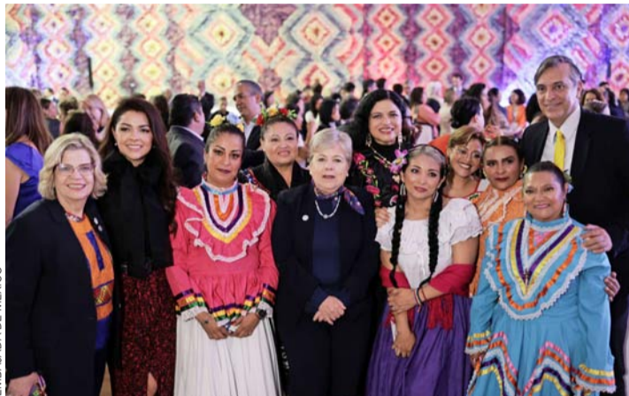
La Canciller mexicana Alicia Bárcena ha participado activamente en diversas actividades de la PEF.