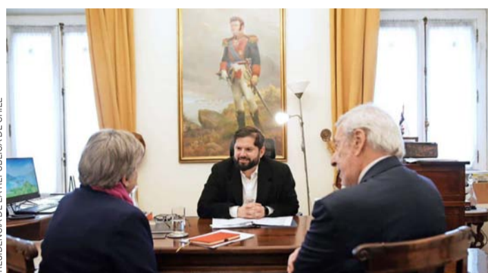
La secretaria de Estado mexicana se reunió con el Presidente Boric.

Un mecanismo de esta naturaleza conduce a las partes a realizar encuentros periódicos del más alto nivel para profundizar el diálogo político sobre cuestiones bilaterales e internacionales de interés mutuo. En la Asociación Estratégica que ambos países forjaron, se establecieron tres comisiones de trabajo que sientan las bases del constante diálogo bilateral: la Comisión de Asuntos Políticos, la Comisión de Cooperación y la Comisión de Libre Comercio. Durante el transcurso de los últimos meses, las tres comisiones tuvieron fructíferas reuniones de trabajo, en donde se registraron avances en tres dimensiones: el fortalecimiento de los contactos entre autoridades políticas al más alto nivel; la decisión de